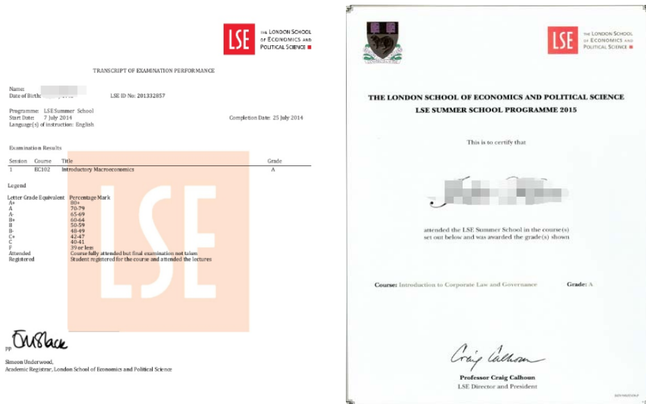
图：LSE 暑期课程成绩单与证书

参加项目的学生与其他国际学生混合编班，由 LSE 进行统一的学术管理与学术考核。课程的考核方式为两次笔试、或一次期末考试加考核作业。完成学习并通过考核后，学生将获得 LSE 颁发的正式成绩单与项目证书。通常，LSE 的课程对应美国教育体系中的 3 个学分。经本校教务处获院系评估认可的学分可转为本校学分。